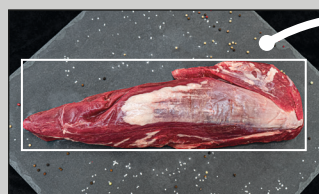
Produit croûté sous forme naturelle